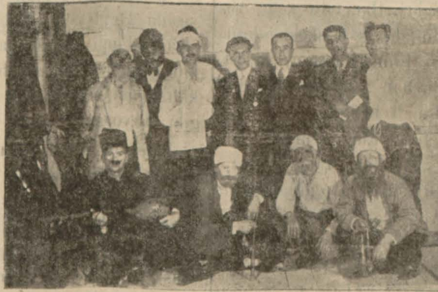
Halkevi Gençleri Bir Temsil Esnasında