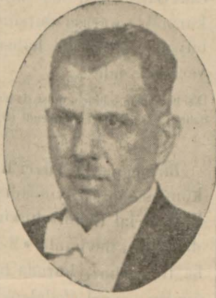
Meclis Reisi Kâzım Paşa Hz. tutuklarını bitirdikten sonra tekrar sürekli alkışlar arasında kürsüyü terkettiler.

Reisicümhur Hazretleri tam saat on beşte, Büyük millet meclisini açış nutkuna başladı. Temamen öz türkçe olan bu nutuk yarım saat sürdü. Gazi Hazretlerinin bu nutukları gerek söylenirken ve gerekse bittikten sonra uzun uzun al-